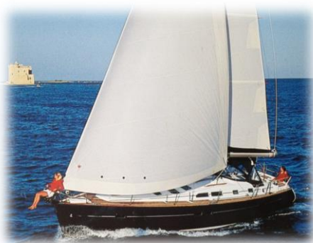
Barca a vela